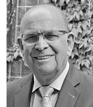
Bijdrage : Theo Laumans

Als meer leden van de KBO zich gerealiseerd hadden, wat deze multivision show over Oost Frankrijk inhield, dan was zaal De Vriendenkring te klein geweest. Nu waren er jammer genoeg maar 30 toeschouwers/bezoekers. Het erg goede weer op deze middag was waarschijnlijk ook wel een oorzaak van de lage opkomst.