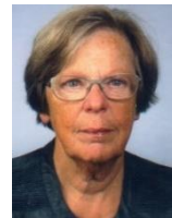
Bijdrage Kay Curfs

Op het moment dat ik dit schrijf zijn we net naar de stembus geweest om onze stem uit te brengen voor het Europese Parlement. Hebben wij invloed op wat er in dit Parlement gebeurt? Ja! Na de definitieve uitslag op 27 mei begint de strijd om de invulling van de belangrijke posities. De voorzitter wordt aangewezen door en uit de grootste partij. Wordt het de Limburger Frans Timmermans? Als er in Europa een nieuw wetsvoorstel ligt, gaat onze Tweede Kamer zich daarover buigen en brengt de gevormde mening naar Brussel via een Nederlandse minister of staatssecretaris. Als een derde van alle Europese parlementen het oneens is met het voorstel, moet het voorstel veranderd worden. Is de helft van de parlementen het oneens met het voorstel, dan gaat het voorstel van tafel.