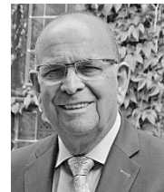
Bijdrage : Theo Laumans

Het was reuze gezellig en erg lekker. Dus wordt het beslist een jaarlijks terugkerend programma onderdeel.