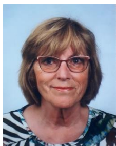
Bijdrage: Ine Beurskens

Ik wil u nu vast attent maken op een activiteit die we nog nooit eerder hebben gedaan: luchtbuksschieten . Zet de datum hiervoor alvast in uw agenda: dat is woensdag 10 november om 14:00 uur . Dan zijn we weer te gast bij het Schutterijgebouw aan de Streekweg. Het schieten gebeurt binnenshuis op kartonnen kaartjes met een buks die op een standaard staat. Dus niet zwaar tillen, maar wel in wedstrijdvorm uw mannetje of vrouwtje staan. We spelen in groepsverband, maar ook individueel komt er een winnaar uit de bus. U krijgt koffie/thee en vlaai en omdat we spelen in competitieverband zijn er ook enkele prijzen te winnen. Meer informatie, onder andere over de eigen bijdrage, alsmede het aanmeldstrookje, vindt u in de volgende nieuwsbrief. Dus mannen, maar ook vrouwen, laat je uitdagen en doe mee!