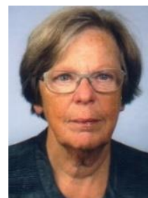
Bijdrage: Kay Curfs

Uw biologische klok kan om verschillende redenen ontregeld zijn. Kunt u moeilijk in slaap komen of heeft u juist een probleem met doorslapen? Veel mensen overwegen dan om een tijdje een slaapmiddel te gebruiken. Vooral bij ouderen brengen slaapmiddelen risico's met zich mee. Ook kunnen slaapproblemen verergeren na het stoppen met de slaapmiddelen. Slaapmiddelen lijken misschien ideaal, maar ze hebben veel nadelen en risico's, vooral op langere termijn.