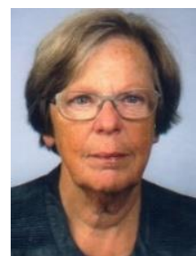
Bijdrage: Kay Curfs

Bent u mantelzorger en heeft u een bijstandsuitkering? En merkt u dat u sommige uitstapjes niet maakt, omdat de kosten van trein, bus of auto te hoog zijn? Vraag dan bij uw gemeente of u in aanmerking komt voor bijzondere bijstand . Dit is een uitkering waarmee u extra en bijzondere kosten kunt betalen.