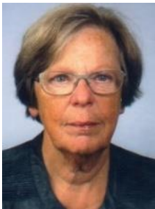
Bijdrage: Kay Curfs

De volgende reguliere nieuwsbrief verschijnt 23 januari 2024